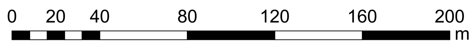
Wyrus ze studium uwarunkowań i kierunków zagospodarowania przestrzennego Miasta Kutna