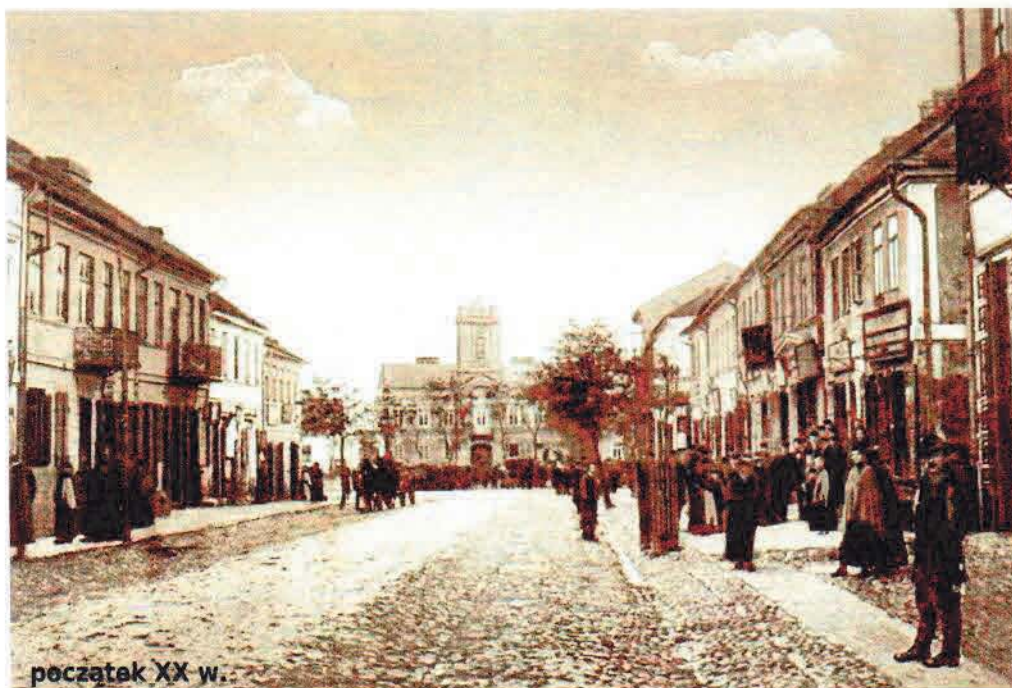
początek XX w.