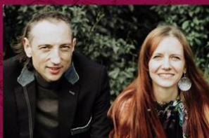
GUŁAJE FOLK SYSTEM