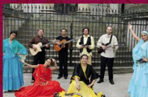
PERŁA I BRACIA

KONCERTY 9-10 września PLAC PIŁSUDSKIEGO