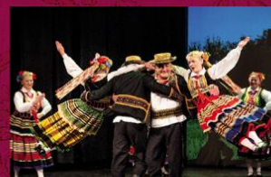
ZPIT ZIEMI KUTNOWSKIEJ