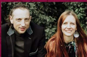
GUŁAJE FOLK SYSTEM